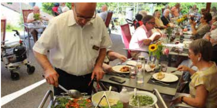
Grillades de cet été